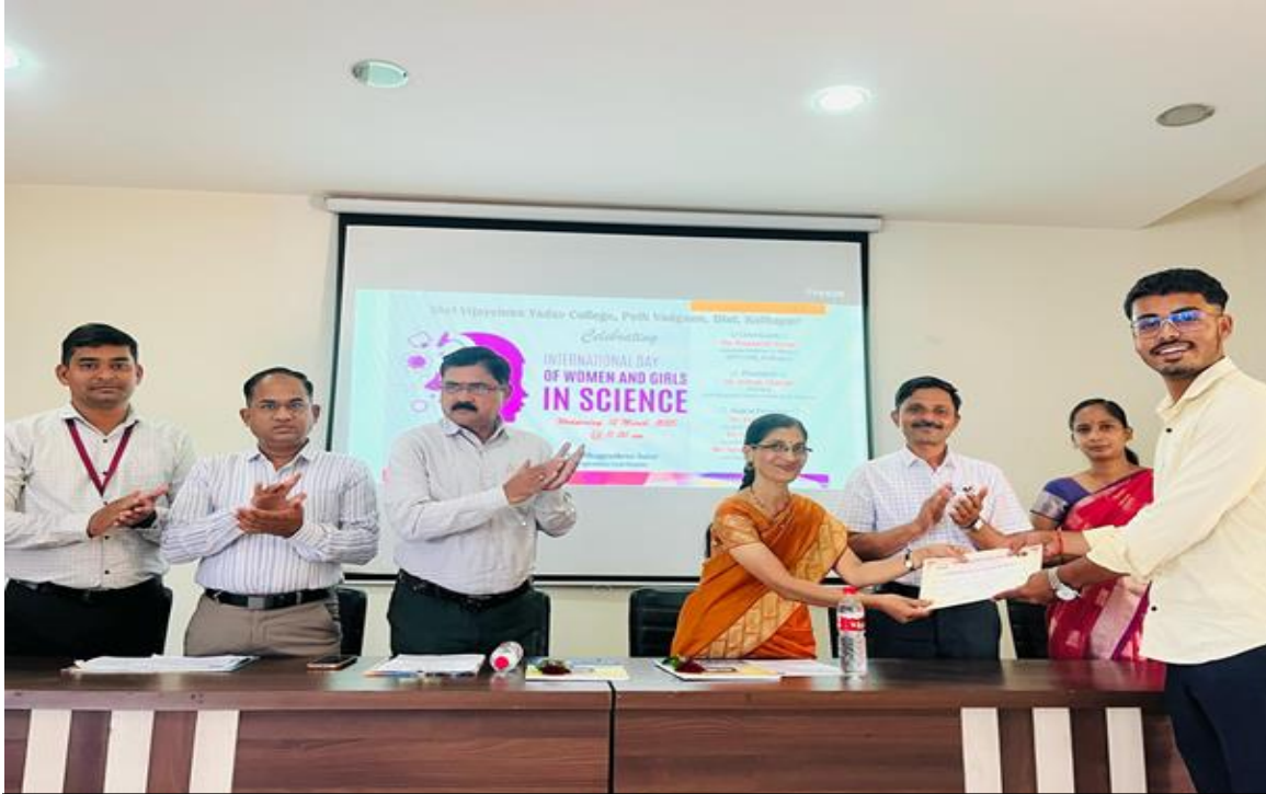
Prize Distribution of Various Competitions Held During the Academic Year by the Chief Guest.