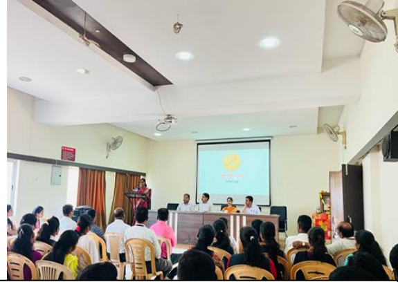
Opening Address and Welcome speech of the Program