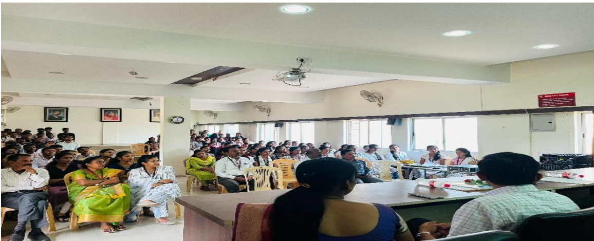
Remarkable Presence of Faculty and Students